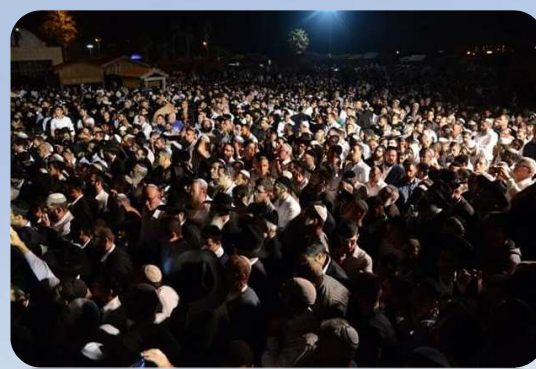
חלק מהאלפים בלוויה